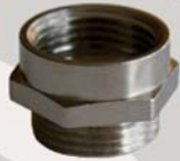
PG - ISO