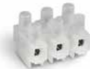
Serie H Versione rialzata Raised base version