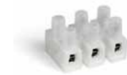
Serie LP Versione con lamella di protezione Version with wire protector