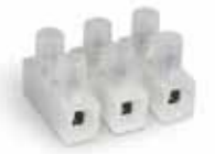
Serie F Versione ribassata Flat base version